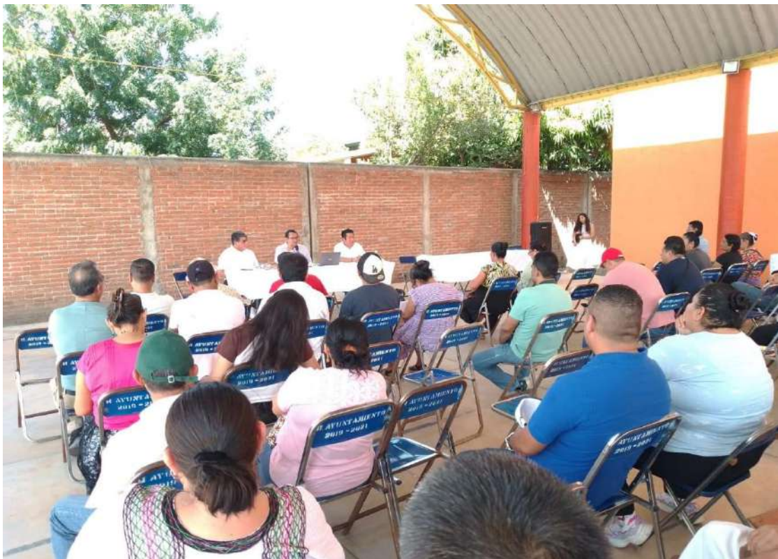
Figura 7. Plenaria general con personal del INPLAN