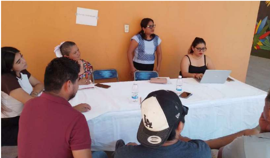
Figura 4. Mesa Temática: Cultura y Biodiversidad. Municipio de San Pedro Comitancillo, 2025–2027.