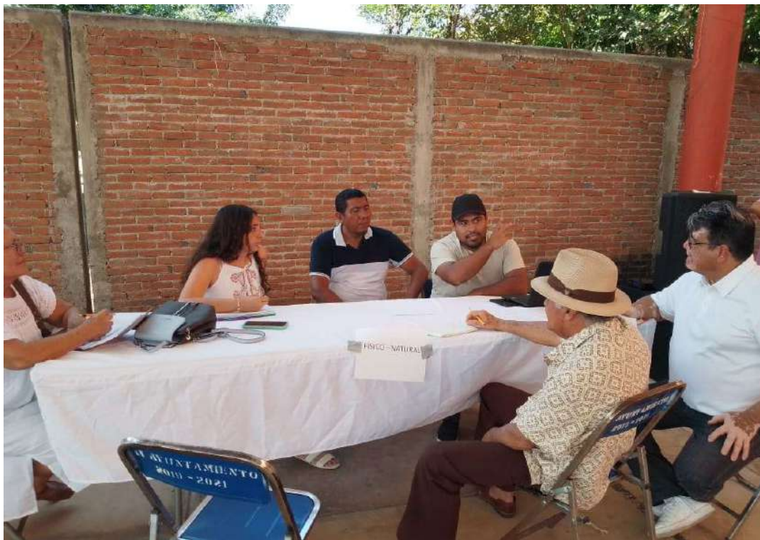
Figura 1. Mesa Temática: Medio Físico y Natural. Municipio de San Pedro Comitancillo, 2025–2027.