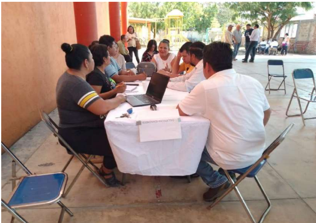
Figura 3. Mesa Temática: Económico-Productivo. Municipio de San Pedro Comitancillo, 2025–2027.