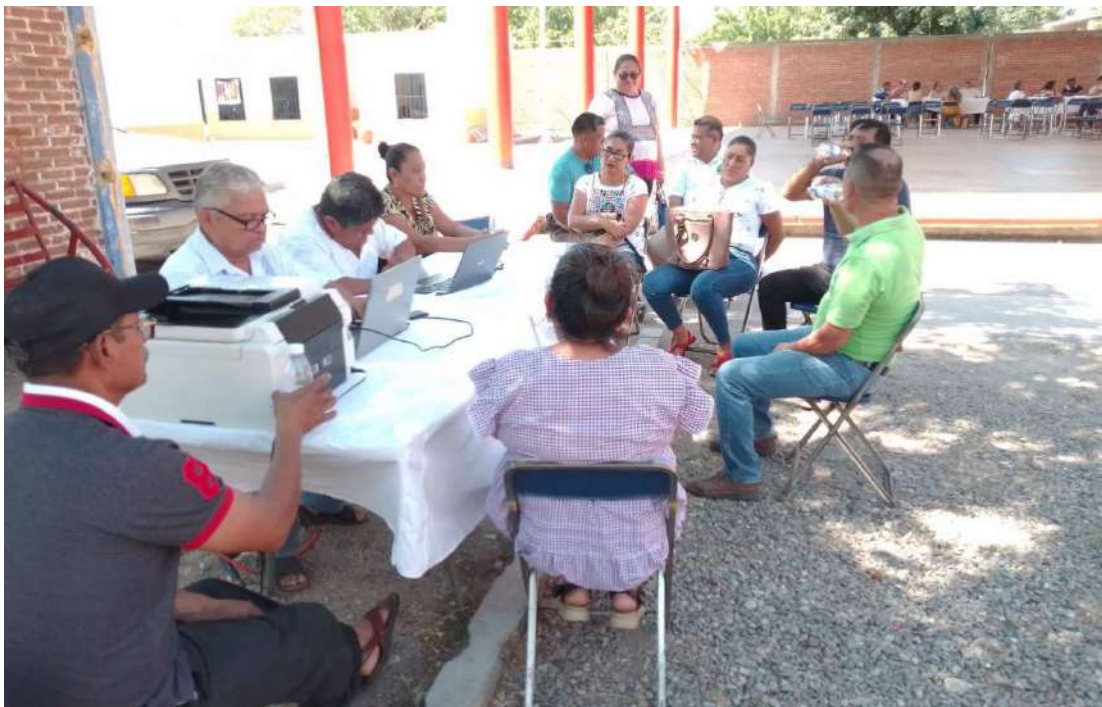
Figura 5. Mesa Temática: Equipamiento e Infraestructura. Municipio de San Pedro Comitancillo, 2025–2027.