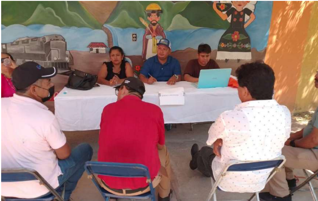
Figura 6. Mesa Temática: Movilidad y Comunicaciones. Municipio de San Pedro Comitancillo, 2025–2027.