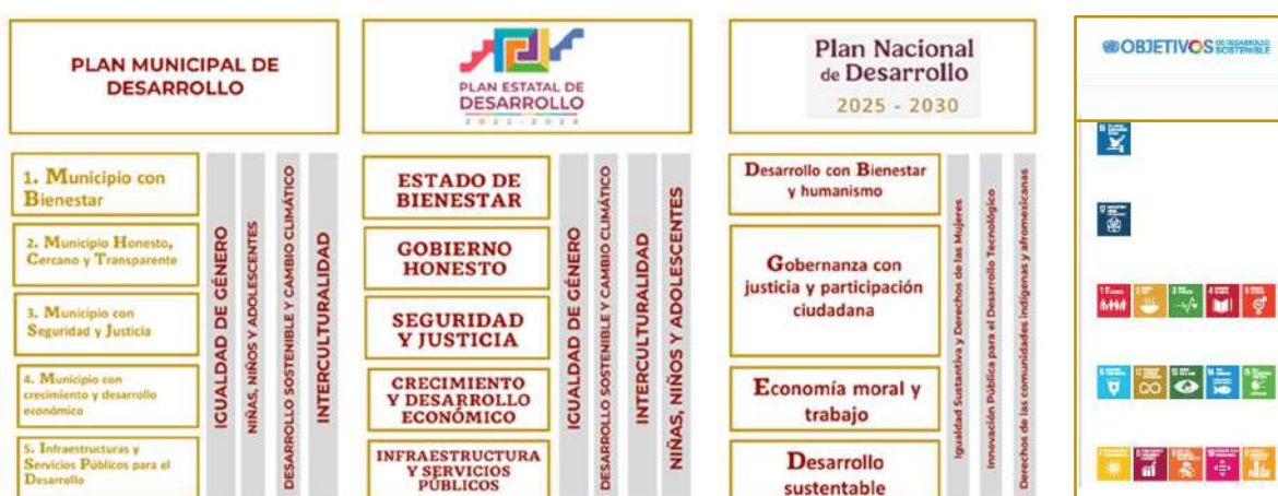
Figura 8. Alineación del PMD con Instrumentos de Planeación Estatal, Nacional y la Agenda 2030.

El Plan Municipal de Desarrollo (PMD) de San Pedro Comitancillo ha sido elaborado con un enfoque integral y multisectorial. Se encuentra plenamente alineado con los principios rectores del Plan Nacional de Desarrollo 2025-2030 (PND), el Plan Estatal de Desarrollo 2022-2028 (PED) y los Objetivos de Desarrollo Sostenible (ODS) establecidos en la Agenda 2030 de la Organización de las Naciones Unidas. Esta alineación asegura la coherencia y articulación de las políticas públicas municipales con los marcos estratégicos nacional e internacional, fortaleciendo la capacidad institucional para responder de manera efectiva a los desafíos actuales y futuros del desarrollo (ver Figura 8).