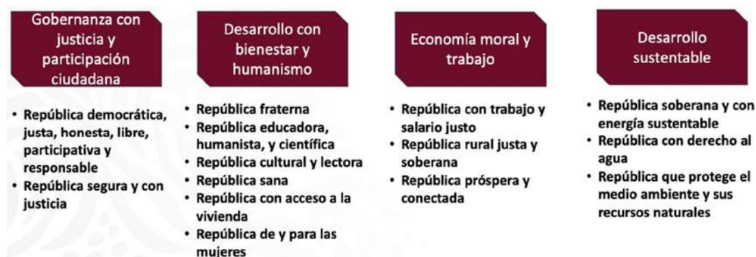
Figura 9. Ejes generales con sus repúblicas correspondientes. Plan Nacional de Desarrollo 2025-2030.

Es el documento rector de la planeación en el país, se conforma de cuatro ejes generales y tres transversales. Los ejes generales integran las 14 Repúblicas ( ver Figura 9 ) que contienen los 100 compromisos del Gobierno (Secretaría de Bienestar, 2025).