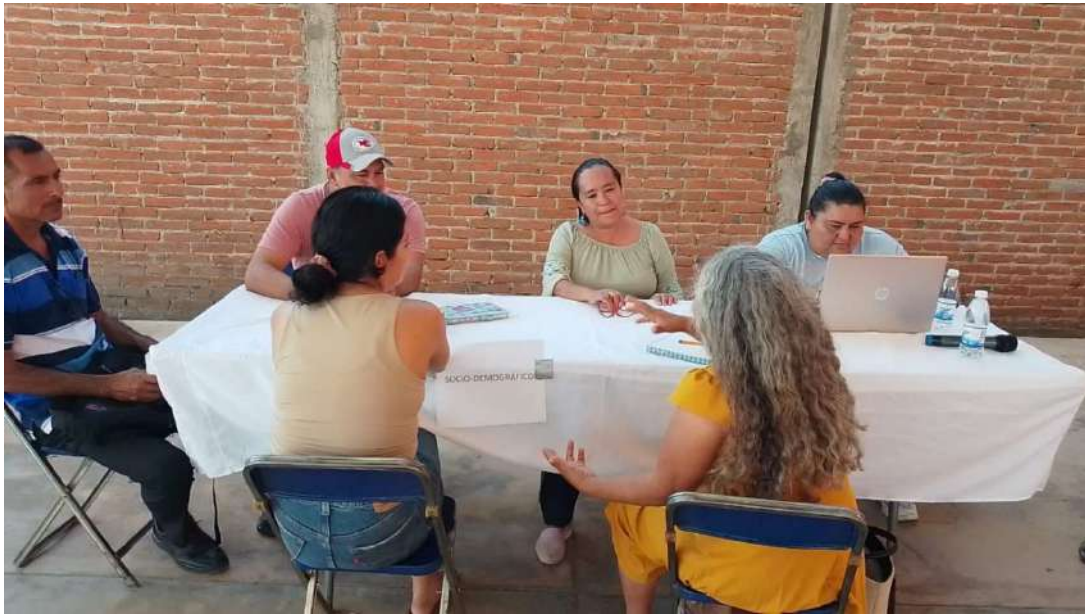
Figura 2. Mesa Temática: Sociodemográfico. Municipio de San Pedro Comitancillo, 2025–2027.